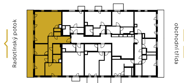
✓ pohled východní