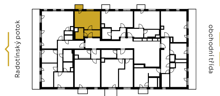
✓ pohled východní