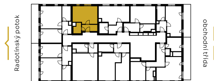
▼ pohled východní