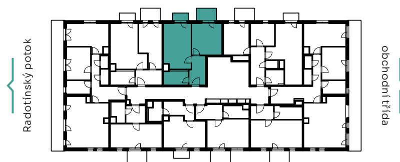
✓ pohled východní