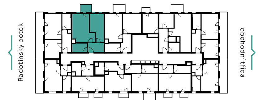
✓ pohled východní