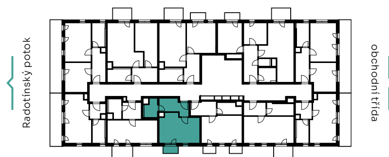
✓ pohled východní