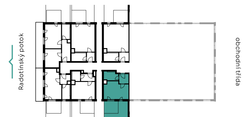
✓ pohled východní