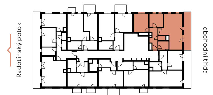
✓ pohled východní