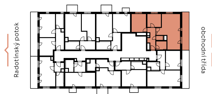
✓ pohled východní