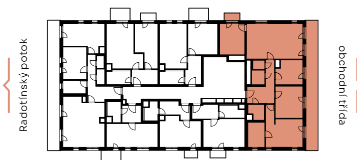
✓ pohled východní